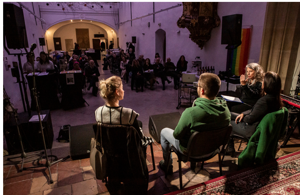
Ako brániť informačný priestor v hybridnej vojne, 15. 11. 2022, Bratislava